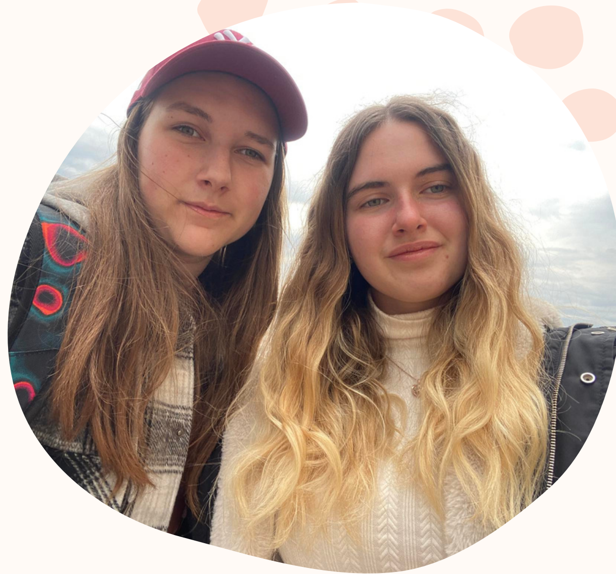
popoludnie so spolužiakmi a hostujúcou rodinou