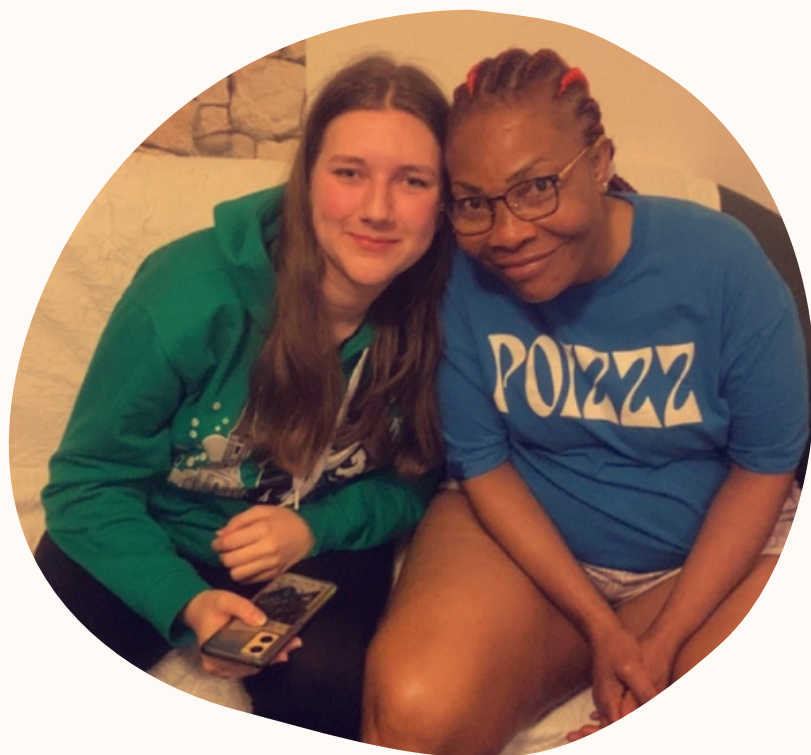
Zoznámenie sa s rodinou