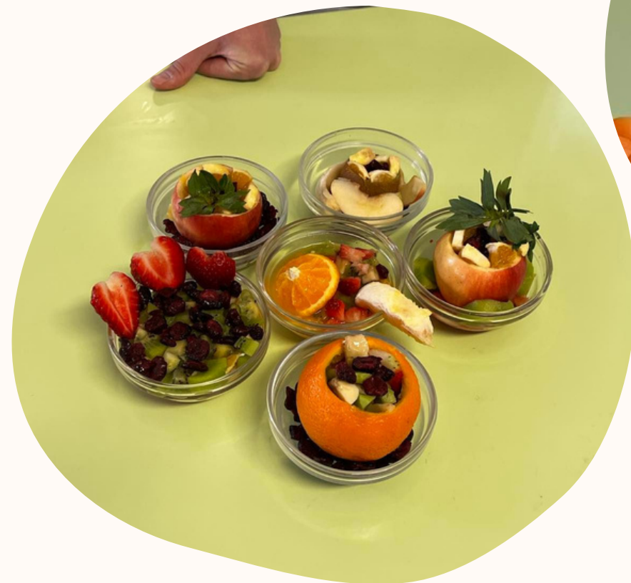
príprava ovocného šalátu