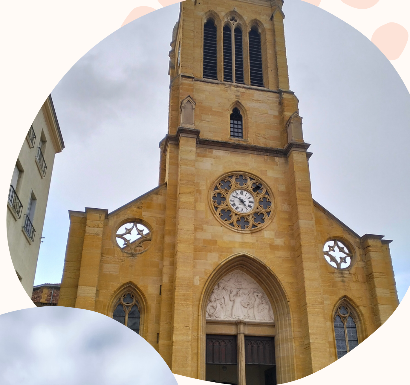
Zoznámenie sa s mestom